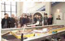
平成21年度研修会 (平成21・11・19、ソラール)