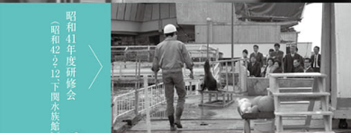
昭和41年度研修会 (昭和42より2下関水族館)