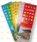
ミュージアムおでかけガイド in やまぐち