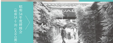
昭和54年度研修会 (昭和54より20、ひろの園)