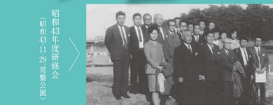
昭和43年度研修会 (昭和43より29、常盤公園)