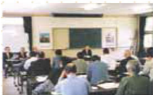
平成13年度総会 (平成13・5・17、県立山口博物館)