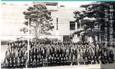
昭和44年度全国博物館大会 (昭和41より、県立山口博物館)