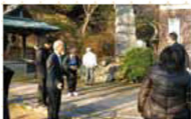
平成24年度研修会 (平成24・12・6、伊藤公資料館)