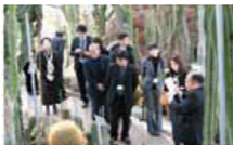
平成23年度研修会 (平成24・2・2、ときわミュージアム)