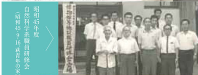
昭和45年度 自然科学系職員研修会 (昭和45より9、16萩青年の家)